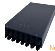
Netzteile BASIC TT und PRO TT